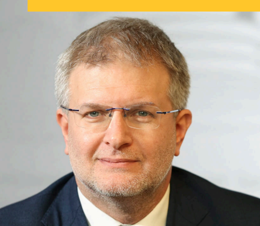
Europarlamentare Carlo Fianza