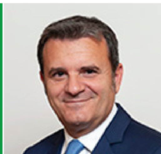
Vicepresidente del Senato Gian Marco Centinaio