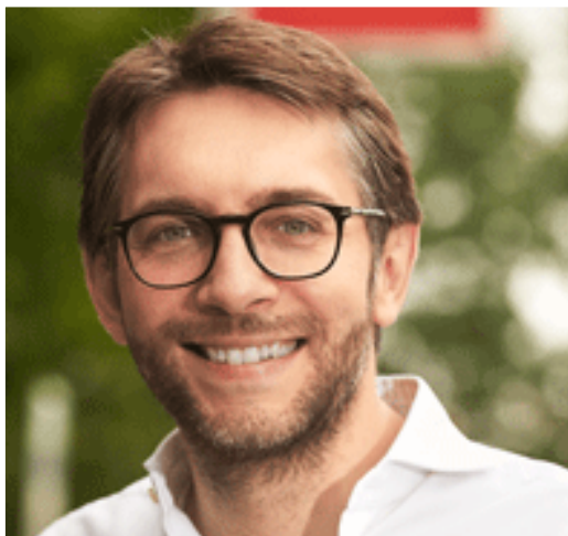
Europarlamentare Pierfrancesco Maran